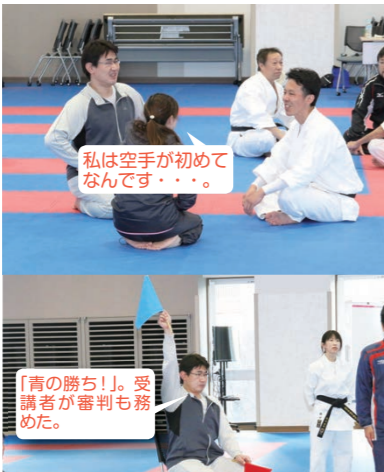
団体形のトーナメント。3人組でチームを作り、自己紹介の後、男女混合、初心者・経験者混成チームで競い合った。