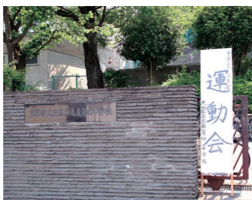
大田区池上にある大森第四中学校。