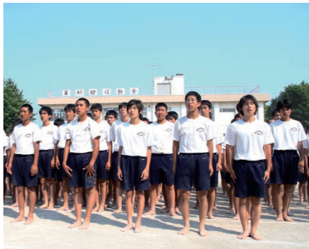
発表後の整列。生徒たちにはやり遂げた達成感があった。初めて空手道を見て保護者も興味津々！