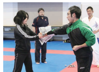
新聞紙を使って突きの強さ・間合いの感覚を測る練習。