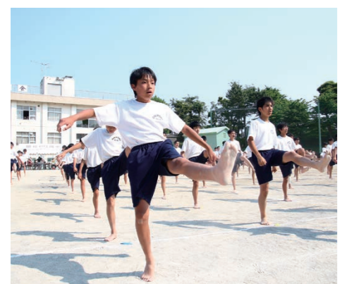
基本の閉足立ちからの前蹴りも一糸乱れず行った。

く、高橋先生が快諾し、校長先生も高橋先生の人柄・実績を評価し、運動会までの約二週間、体育の時間を使って空手の授業を行うことになったそうです。「生徒達は男性の空手の先生は怖